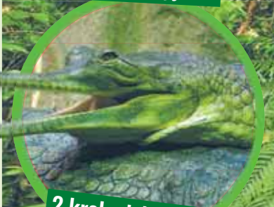
2 krokodyle gawiale