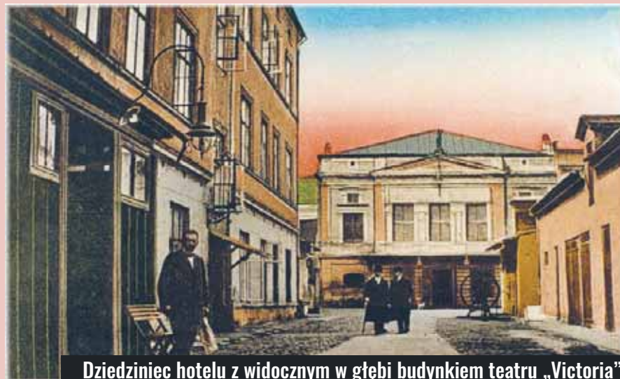
Dziedziniec hotelu z widocznym w głębi budynkiem teatru „Victoria” przy ul. Piotrkowskiej 67 na pocztówce z początku XX wieku