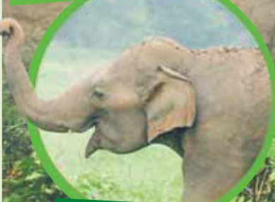
3 słonie indyjskie