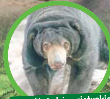
2 niedźwiedzie azjatyckie